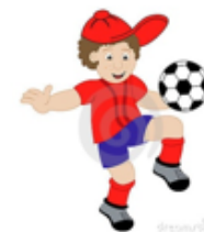
El fútbol es emocionante