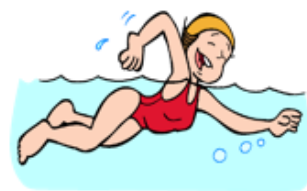
La natación es divertida