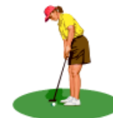
El golf es aburrido y lento