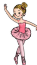
El ballet es difícil