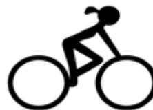
El ciclismo es fácil