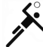
El balonmano es rápido